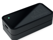
Une Balise Beepings ZEN